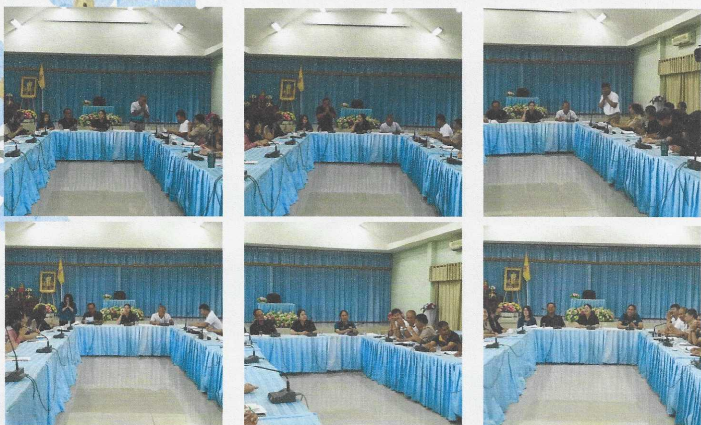
จดหมายข่าว "ชุมชนนิเวศ" ประจำเดือน พฤษภาคม 2569